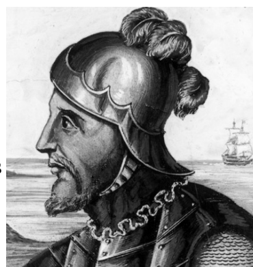
Ilustración 8: Vasco Núñez de Balboa

Es un poblado descubierto y construido por BALBOA y está situado en el golfo de San Miguel, archipiélago de Las Perlas, el Pacífico. Panamá. BALBOA proyectó en ACLA la construcción de embarcaciones grandes y sólidas para explorar las " Tierras del Sur " lo que hoy es el Perú (1517-1518). Varias de estas embarcaciones fueron utilizadas después por Francisco Pizarro en la expedición al PERÚ.