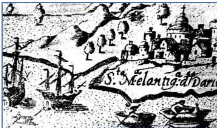
Ilustración 2: Santa María la Antigua del Darién

BALBOA se convierte en ALCALDE del recién fundado poblado de SANTA MARÍA. Al poco tiempo emprende una expedición (1512) al golfo de Urabá (Colombia) y surcando el río Atrato intentó llegar al MAR DEL SUR, porque unos indígenas le habían hablado de ese mar pasada la montaña.