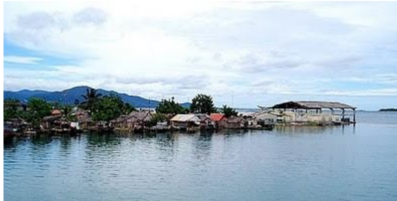
Ilustración 4: Isla de Narganá

La lengua KUNA pertenece a la familia CHIBCHA. Con esta concisa visión de los indígenas KUNAS se puede entender mejor los viajes de BALBOA que los realizó en muy buena armonía con ellos.