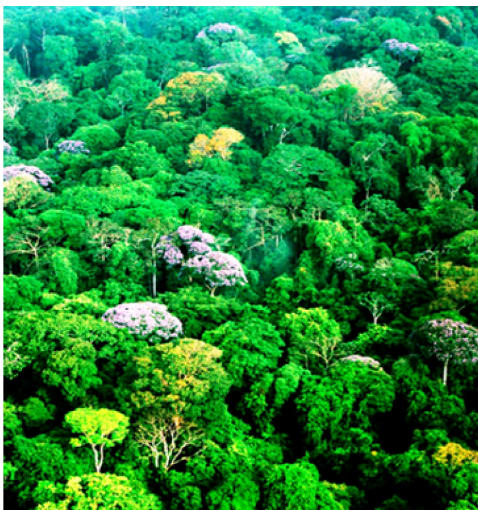
Ilustración 3: Selva del Darién

Pedrarias, ante el fracaso en SANTA MARÍA, se trasladó a otra zona, lo que es hoy PANAMÁ ciudad, fundándola en 1520. Ordenó el traslado la capital de Castilla de Oro de Santa María a Panamá con las personas, ganado y municiones. Santa MARÍA quedó despoblada y olvidada completamente en 1524. Actualmente hay un icono nacional y departamental en el lugar de Santa María la Antigua del Darién en recuerdo de la histórica ciudad.