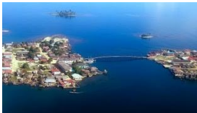
Ilustración 5: Islas de NARGANÁ (izda) y CORAZÓN e JESÛS unidas por un puente.

Y llega BALBOA el día 6 de Setiembre a la comarca del cacique CARETA. Este cacique tenía problemas graves con el poderoso y cruel cacique PONCA. CARETA estaba escaso de alimentos por las guerras con PONCA y no podía darle comida a BALBOA. Éste ayudó al cacique CARETA a vencer a PONCA haciendo un pacto de amistad en el que suministraría comida, agua y ayudas varias a BALBOA.