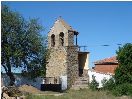
Ilustración 11: Torre de la Iglesia de Solanilla