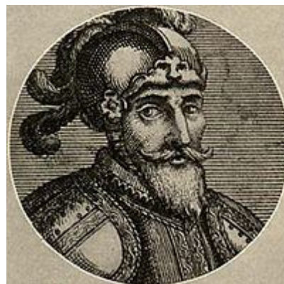
Ilustración 9: Pedro Arias (Pedrarias)

BALBOA fue sentenciado y decapitado junto con 4 de sus amigos en ACLA, como prueba de la conspiración, fingida y aparente en el poblado de