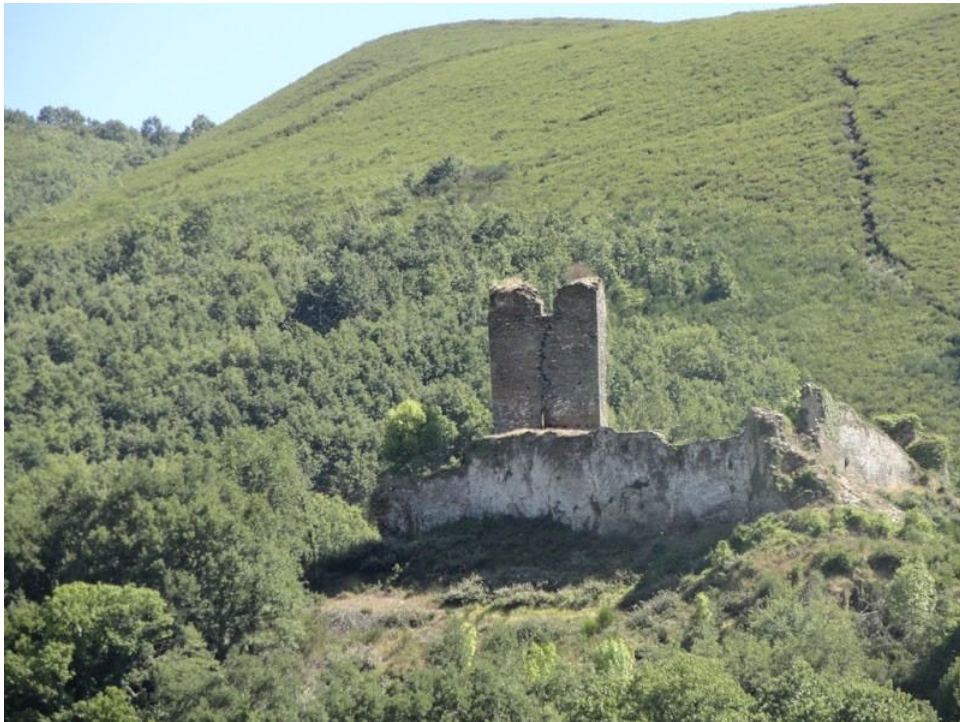
Ilustración 10: Castillo en Ruinas de Balboa