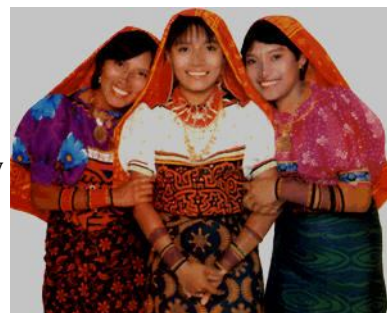
Ilustración 6: GRUPO DE JÓVENES KUNAS

levantaba envidia, sobre todo en PEDRARIAS y algunos más entre los españoles. Pues éste sabía mandar con autoridad y mansedumbre al mismo tiempo. BALBOA Y ANAYANSI formaban una pareja tan unida que ésta tenía amistad con los amigos españoles de BALBOA. Se amaban de verdad...lástima que la ENVIDIA los separara trágicamente. CARETA, el padre, se bautizó con el nombre de FERNANDO en honor al Rey de España. Las crónicas han narrado con espontaneidad y naturalidad la vida del expedicionario y conquistador VASCO NÚÑEZ DE BALBOA, dejándonos un ejemplo de AMOR entre los dos litorales: ATLÁNTICO Y PACÍFICO... los mares que ÉL UNIÓ.