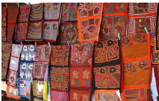
Ilustración 7: TELAS PARA HACER MOLAS - Vestido de la mujer