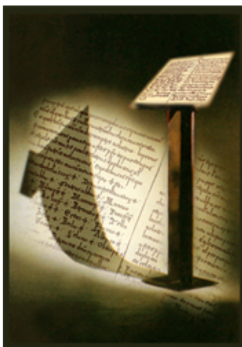
Instalación sobre los Cartularios