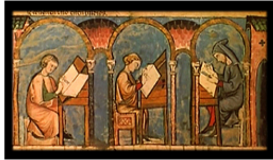
Escritorio de Cartularios

El Obispo Juan levanta en VALPUESTA un monasterio de monjes guiados por la regla de San Fructuoso en el año 804 siglo IX. Este monasterio de SANTA MARÍA fue durante trescientos años uno de los más florecientes y representativos del Norte de España por ser :