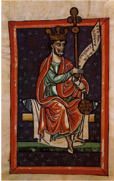
El Rey Fernando I de León y Conde de Castilla. (año 1016 al 1065 s.XI)

VERMUDO III Rey del Reino de León murió en Septiembre de 1037 s.XI en la batalla de Tamarón, Burgos, al intentar reconquistar las tierras ocupadas, entre el río Pisuerga y el río Cea, por el Rey García de Navarra. La muerte de VERMUDO III convierte a su hermana SANCHA en heredera al Reino de León. SANCHA intervino hábilmente ante los nobles del reino para apaciguarles y aceptaran a su esposo, Fernando, como Rey del Reino de León.