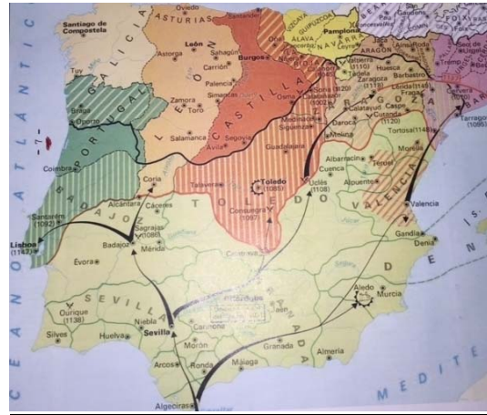
Mapa de Castilla y otros reinos