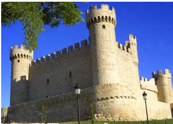
Castillo de Omlillos de Sasamón, Burgos

Rodrigo – Primer Conde de Castilla. Año 850 al 873, siglo IX.