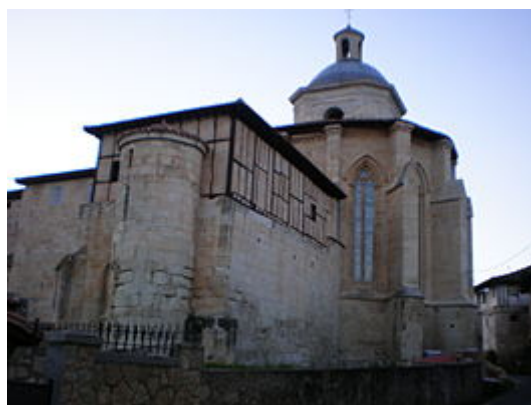
Colegiata de Valpuesta

El tercer domingo de Pascua celebran la romería a la parroquia de Valpuesta (Colegiata) acudiendo muchos fieles de las localidades vecinas, portando cruces con el nombre de sus localidades.