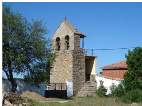
Torre de la Iglesia de Solanilla