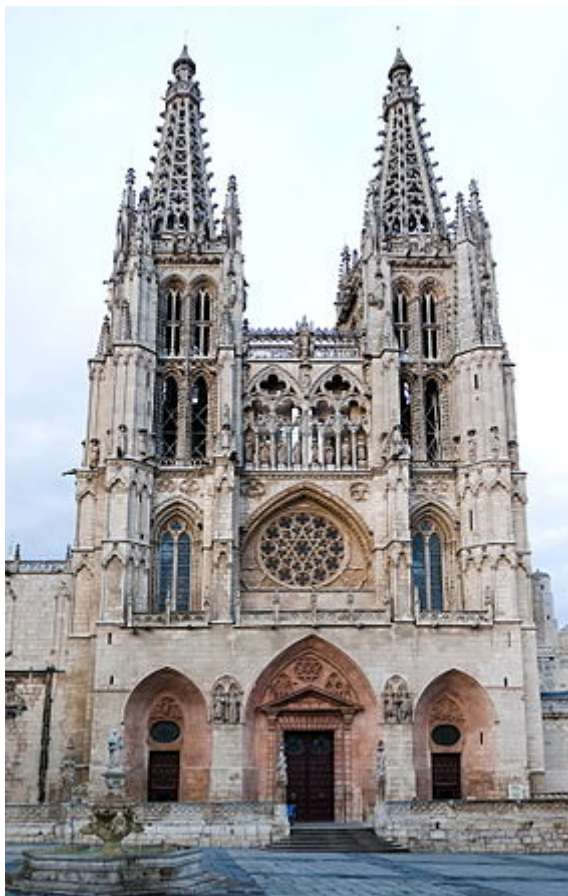
Catedral de Burgos, España

Estimado lector... en este ENSAYO encontrará: una visión HISTÓRICA, una visión GEOGRÁFICO-SOCIAL y una visión LINGÜÍSTICA. Estoy seguro que quedará satisfecho de haberlo leído.