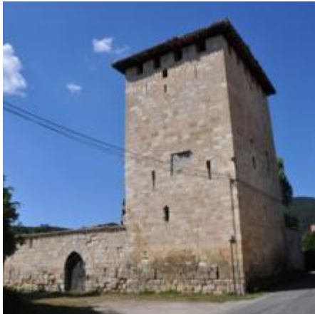
Torre de Valpuesta (Torre de los Condestables)

El nombre “Vallis Posita” es en Latín que significa: situada en un valle... rodeada por valles. La palabra VALPUESTA es muy apropiada. VALPUESTA dista de Burgos 90 Kms., 66 de Bilbao, 45 de Vitoria, 30 de Miranda de Ebro y 10 de Berberana, su municipio actual.