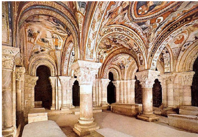
Panteón de los Reyes de S. Isidoro, León