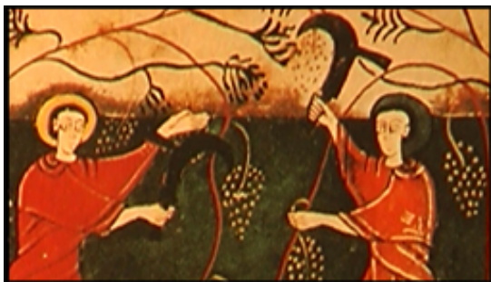
Miniatura del Beato de Liébana

(vocabulario). UNA GEOGRAFÍA privilegiada en CASTILLA, que limitaba por el Este con Navarra y Aragón, por el Oeste con la región Astur-Leonesa y de todas incorporó terminología y formas lingüísticas de los dialectos y hablas regionales limítrofes. Este fenómeno es denominado “aporte lingüístico al Castellano” que enriqueció y fortaleció al idioma.