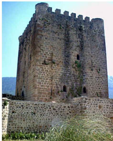
Torre medieval de los Velasco en Lezana de Mena, plena Bardulia

Es muy posible que los vascones obligaran a estos pueblos a desplazarse al Oeste. Los BÁRDULOS (Bardulia) fueron, sin lugar a dudas, el germen y origen geográfico y demográfico de Castilla la Vieja en el año 860, siglo IX.