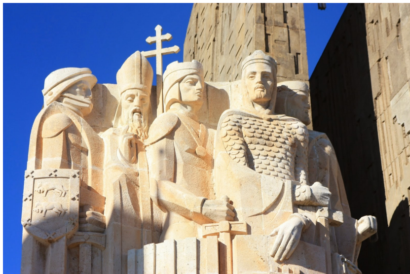
Ilustración 1: Monumento a la Batalla de las Navas de Tolosa (La Carolina, Jaén)