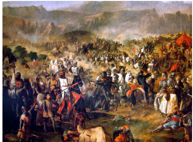
Ilustración 2: Batalla de las Navas de Tolosa, de Van Halen

- El Papa Inocencio III extendió una bula llamando formalmente a todos los cristianos europeos a colaborar y ayudar a España en la batalla de las Navas de Tolosa, porque el Sur de Europa corría peligro de invasión por los musulmanes. Los voluntarios se llamaban " cruzados " porque llevaban una cruz en el pecho como distintivo.