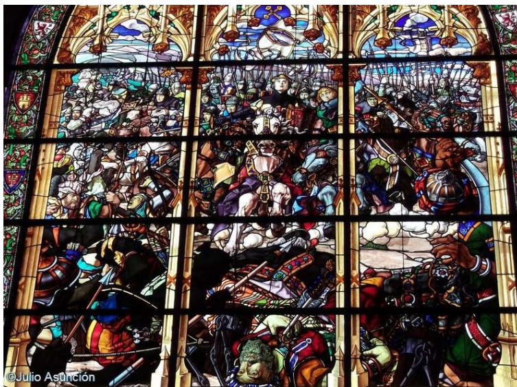
Ilustración 4: Sancho « el Fuerte » de Navarra en la Batalla de las Navas de Tolosa (vidriera en Roncesvalles)

Desfiladero de Despeñaperros. Por este difícil y escabroso desfiladero tuvieron que pasar los miles de combatientes cristianos sorteando puestos de musulmanes que intentaban obstruirles el paso. La leyenda cuenta que un pastor les guió por un paso libre de musulmanes.