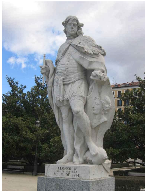
Ilustración 3: Alfonso VIII de Castilla. Ecultura de Juan de Villanueva Barbales, 1753.

Los países que participaron fueron los siguientes: Marruecos. (Rif) Almohades. El país que aportó el mayor número de combatientes y el que dirigió la batalla. Argelia (Bereberes). Libia con sus arqueros. Senegal (Guardia negra defendiendo el puesto de mando).Subsaharianos . Infantes voluntarios de Al-Andalus, muy bien armados. Estaban descontentos con el Califa e influyó en su bajo rendimiento. Había mercenarios de muchos países. La Tienda o Puesto de mando estaba rodeada de voluntarios fanáticos encadenados y enterrados medio cuerpo que habían jurado morir por Alá.