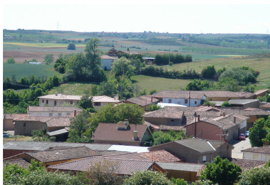
Vista de Solanilla