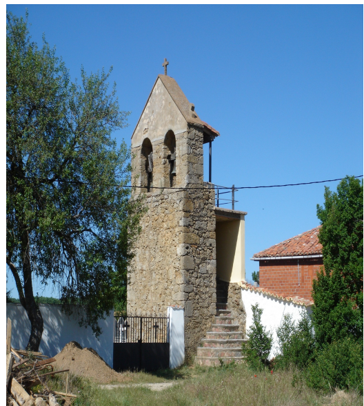
Torre de la Iglesia de Solanilla