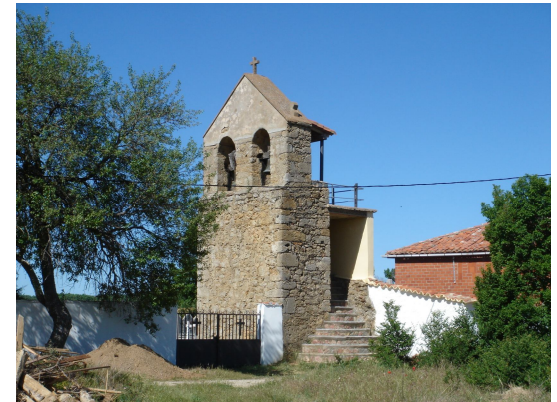
Torre de la iglesia