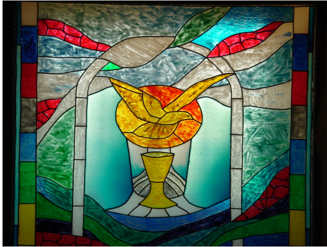
Ventana simbólica del bautismo.

He presentado la definición ampliada de las palabras fundamentales del epitafio, para que el lector compare y valore el texto presentado, y si se corresponde con las definiciones arriba aportadas.