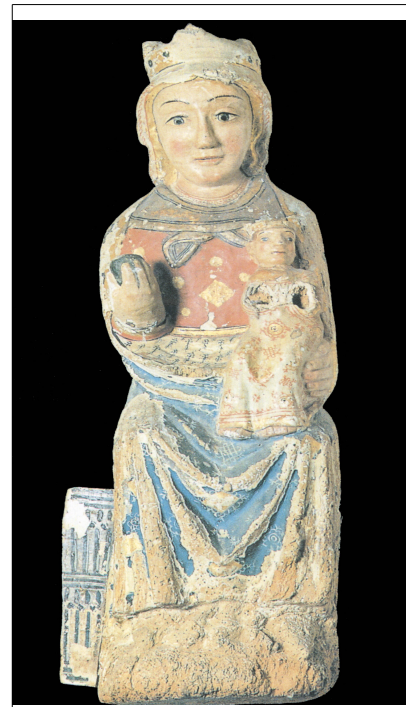
Virgen de las Rutiellas (s.XIII)