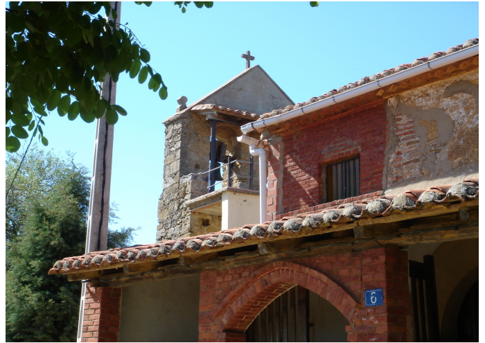
Iglesia de Solanilla

La virgen de Carbajosa del siglo XII junto con la de LAS RUTIELLAS de SOLANILLA del siglo XIII y otras muchas imágenes y objetos de valor están, por razones de seguridad, en el Museo de la Catedral de León. Con una buena réplica o un cuadro se suple la razonable retirada de la imagen original y tenemos la imagen visible.