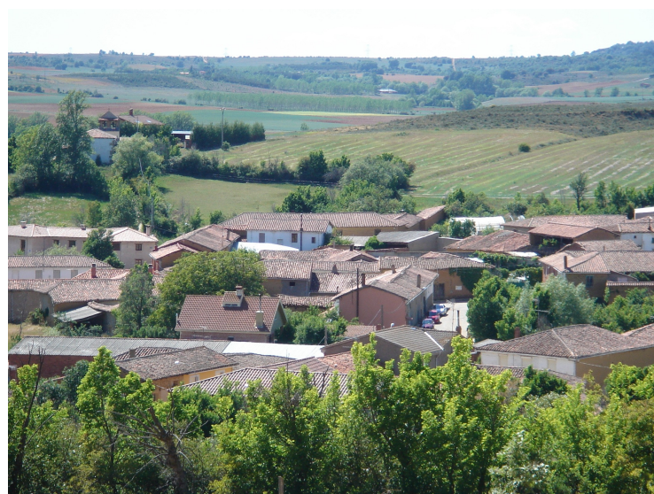
Panorámica de Solanilla

La procesión anual (26 de Abril) a San Isidoro cohesionaba a la comarca de la SOBARRIBA, pueblos cercanos y a la ciudad de León. Para tener una idea de la situación