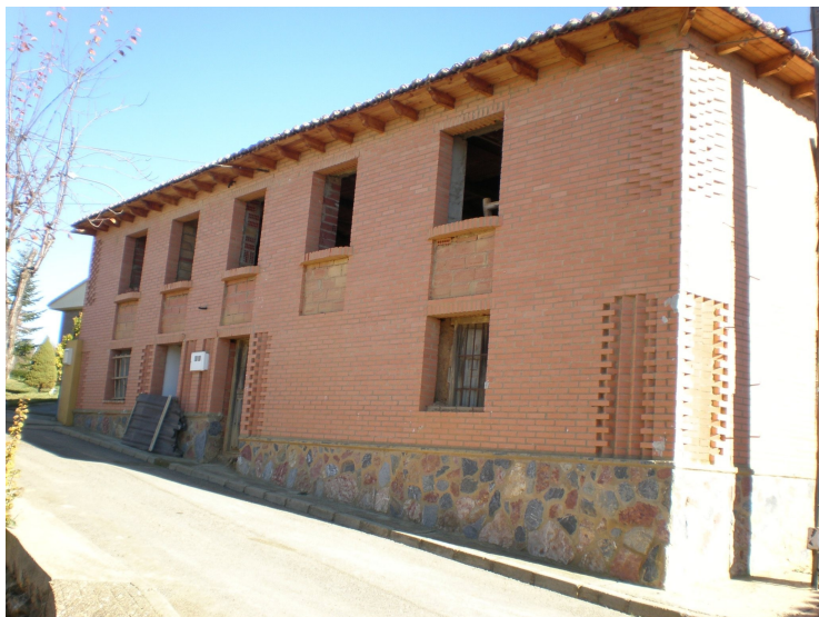
Escuela de Solanilla

En la iglesia de SOLANILLA se ha colocado un cuadro de la VIRGEN DE LAS RUTIELLAS con