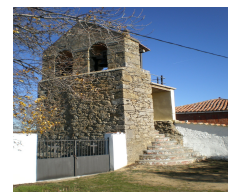
Torre iglesia Solanilla